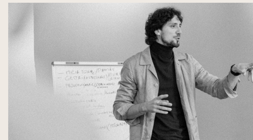
Įrankiai rytojaus pokalbiui