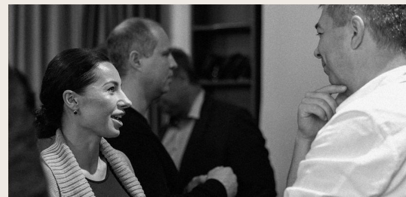
Drauge kuriama saugi erdvė tyrinėjimui