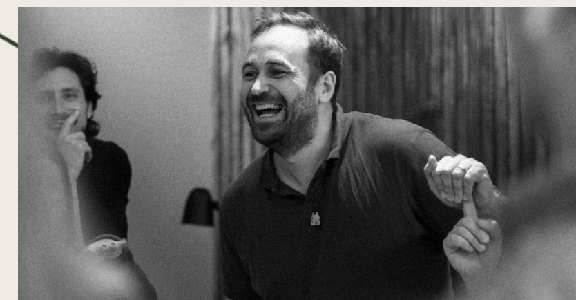
Individualus grįžtamasis ryšys