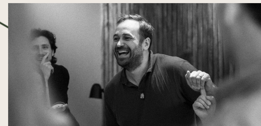
Refleksija ir analizė