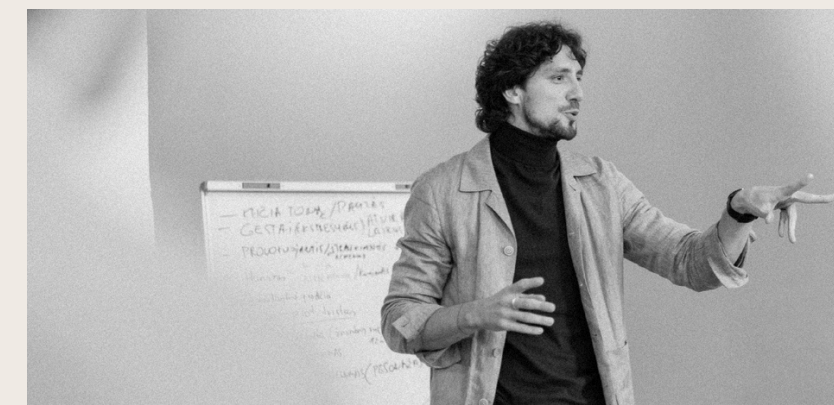
Daug kalbėjimo viešai