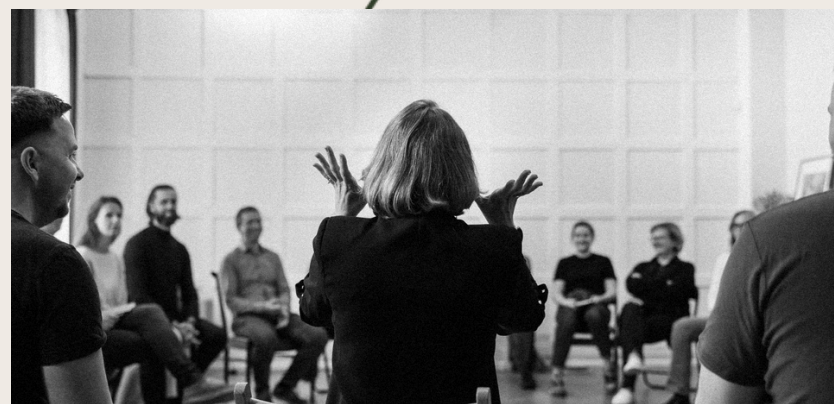
Savęs patyrimas viešajame kalbėjime per muziką, balsą ir improvizaciją